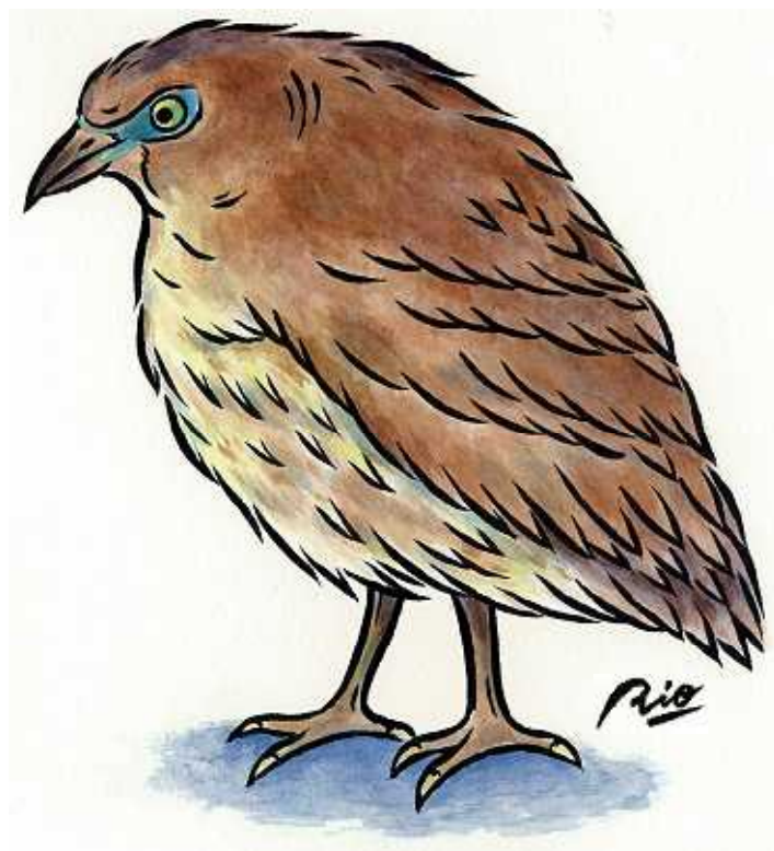
ミゾゴイ Japanese night heron